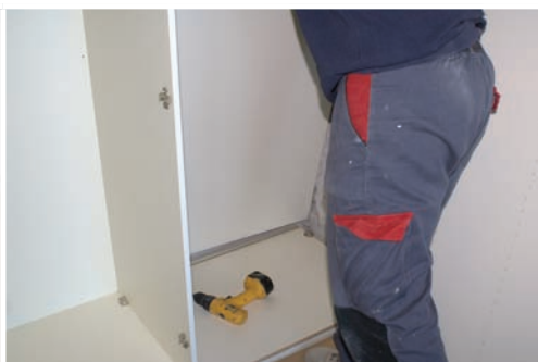
Ensamblar paneles traseros y costados. Assemble back panels and side panels. Aboucher derrière et rubriques.