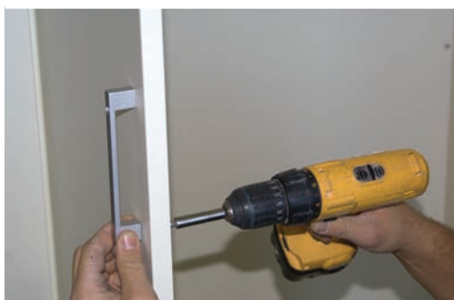
Fijar tiradores. Fix handles. Fixer poignées.