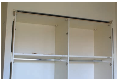
Nivelar y centrar la estructura. Adjust and gauge structure. Ajuster et centrer la structure.