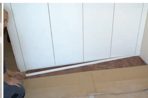
Instalar zócalo. Install apron. Installer culot.