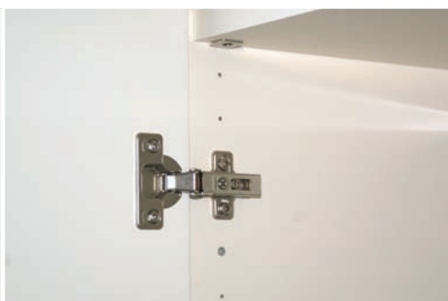
Nivelar posición puertas. Adjust position of the doors. Ajuster position des portes.