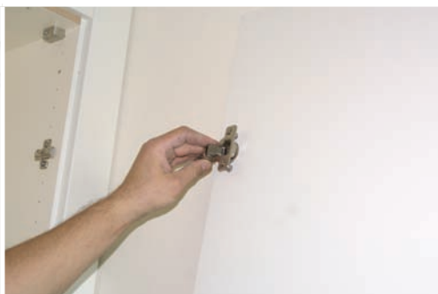
Poner bisagras en las puertas. Place pivots on the doors. Placer charnières aux portes.