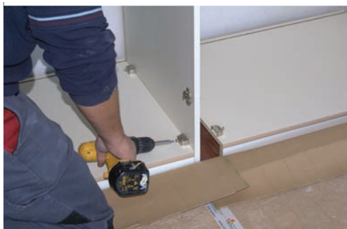
Ensamblar bases inferiores y divisiones. Assemble inferior bases and divisions. Aboucher bases inférieures et divisions.