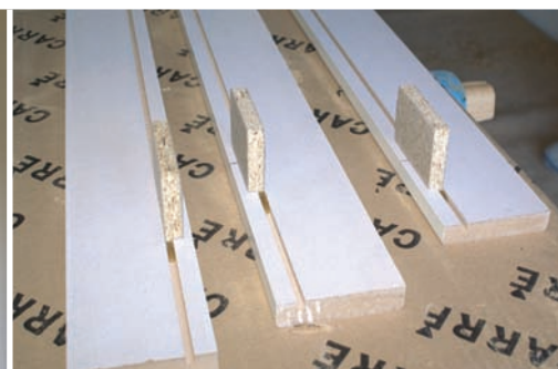
Preparar tapetas. Prepare architraves. Préparer calfeutremets.