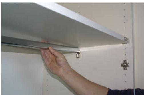
Poner estanterías y barras. Place shelves and bars. Mettre étagères et penderies.