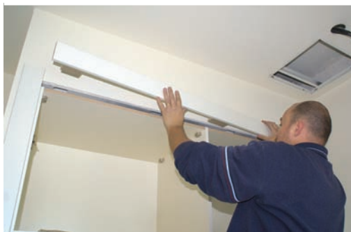
Colocar tapetas. Install architraves. Installer calfeutremets.