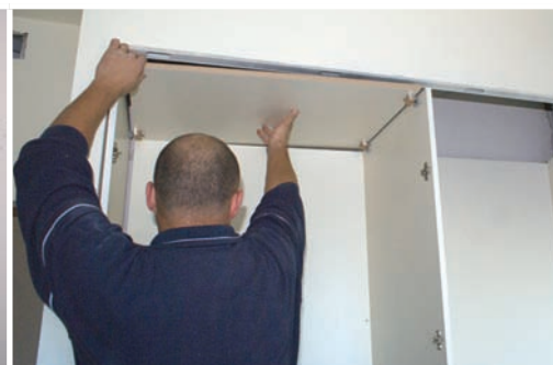
Ensamblar bases superiores. Assemble superior bases. Aboucher bases supérieures.